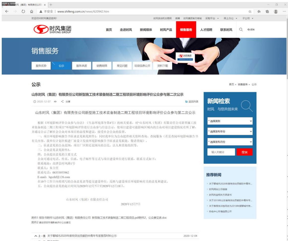
图 4-1 第二次网络公示截图

我单位在建设项目环境影响报告书征求意见稿形成后，于 2020 年 12 月 7 日在时风集团官方网站（ http://www.shifeng.com.cn/news/620942.htm ）进行了第二次网络公示。第二次网络公示截图见图 4-1。