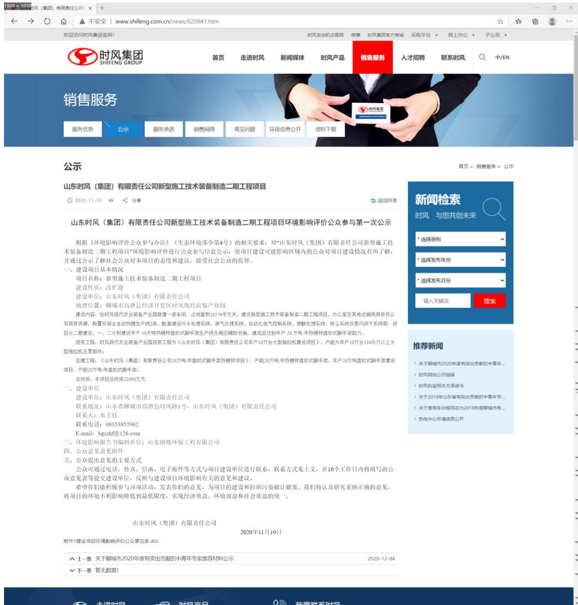
图 3-1 第一次网络公示截图